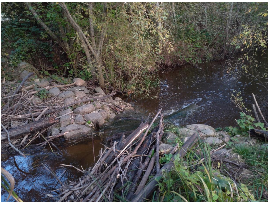
Joonis 3. Lindi II pais 7.10.24 (autor: Anett Reilent).