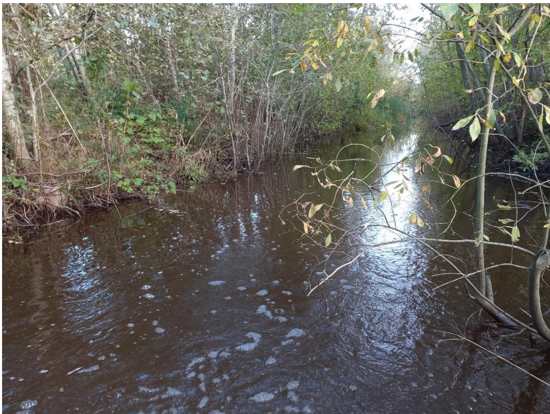
Joonis 4. Lindi II paisust allavoolu kanali ilme 7.10.24, mida võiks mitmekesistada maakividega (autor: Anett Reilent).