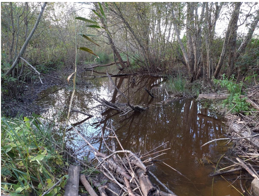
Joonis 5. Lindi II paisust ülesvoolu kanal (7.10.24), mida võiks mitmekesistada maakividega ning suurema languga kohtadesse luua kruusaseid koelmualasid.