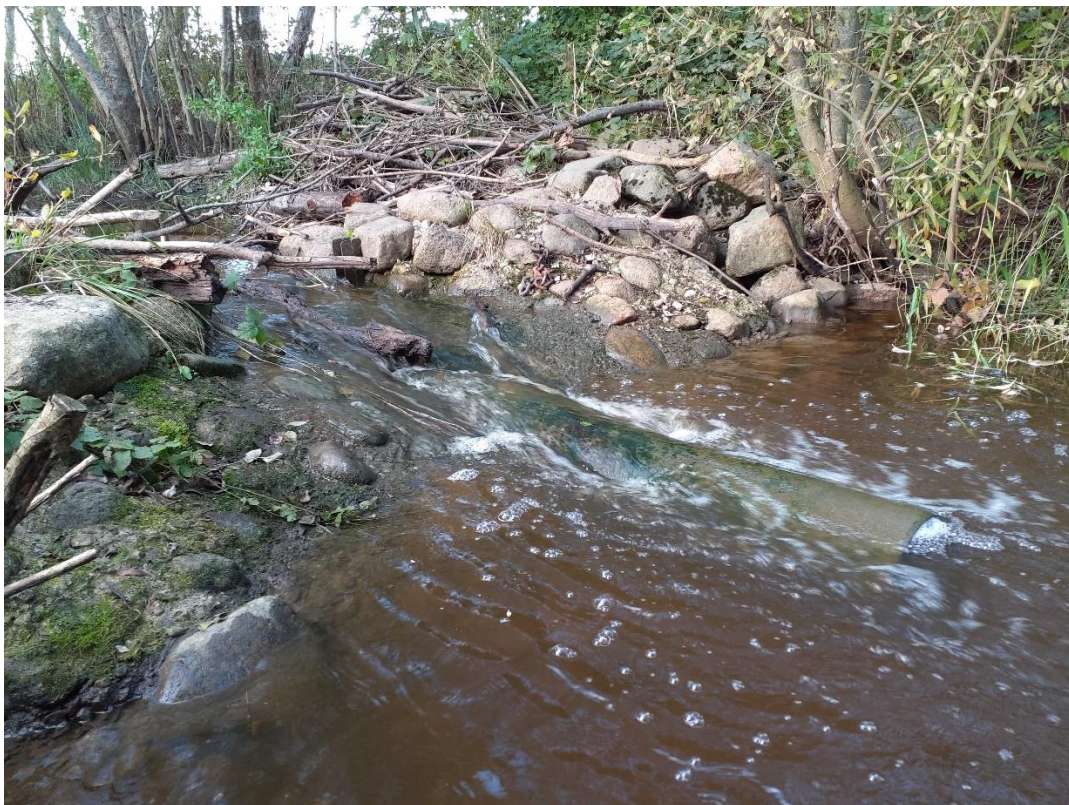
Joonis 2. Lindi II pais koosneb torust, maakividest ja valatud betoonist 7.10.24.